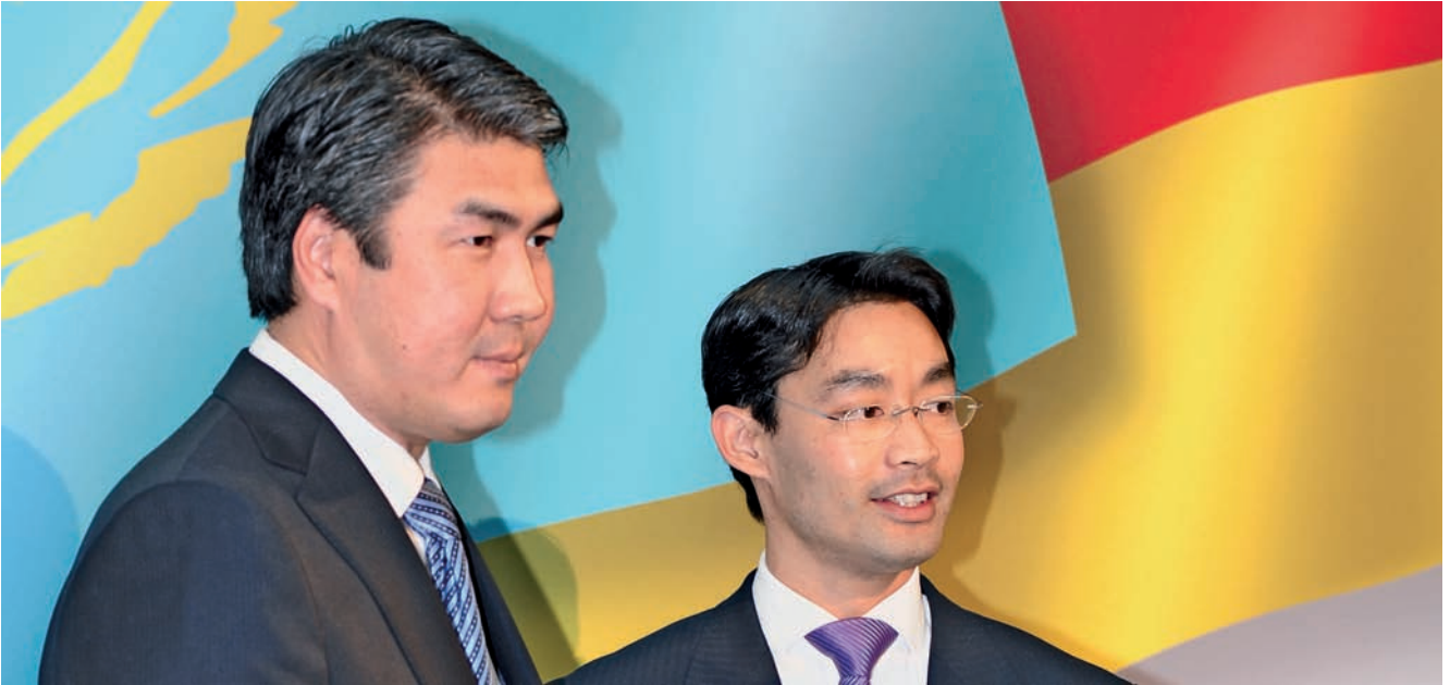
Wollen Rohstoffpartner werden: Bundeswirtschaftsminister Philipp Rösler und der kasachische Minister für Industrie und Neue Technologien, Aset Issekeshev.